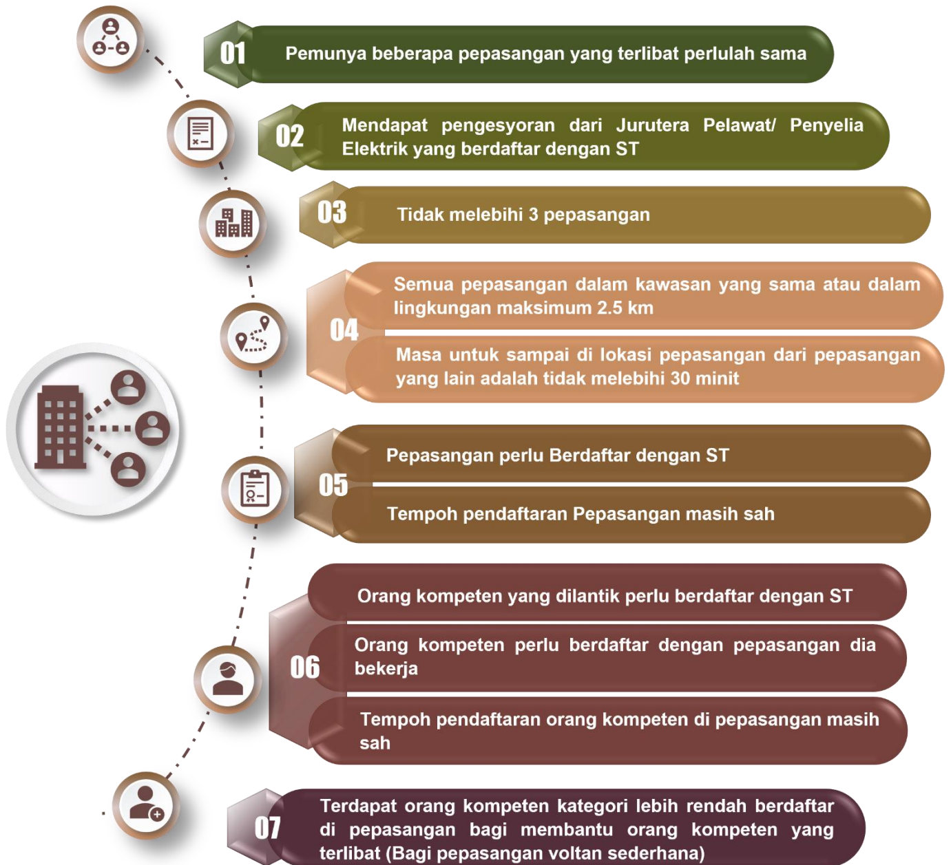
Jadual A: Syarat-syarat Permohonan Orang Kompeten Mengendalikan Beberapa Pemasangan Elektrik

3.1 Sebelum permohonan dilakukan, pemohon perlulah mematuhi syarat-syarat yang telah ditetapkan seperti Jadual A sekiranya orang kompeten akan mengendalikan beberapa pemasangan elektrik.